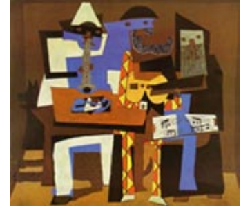
"Tres Músicos" Picasso

1. Cubismo: movimiento artístico de comienzos del siglo XX, que rompe con la idea tradicional del arte como representación de la naturaleza. Los objetos son representados como se sabe que son y no como parecen ser, de forma simultánea en múltiples facetas, en vez de un único punto de vista fijo. Picasso es el pintor más representativo, junto a su amigo Braque. Obras: Paisaje de Horta , Tres músicos