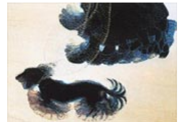
"Dinamismo de un perro con correa" Giacomo Balla

2. Futurismo: movimiento de vanguardia iniciado en 1910 en Italia. Su origen es literario, con el poeta Marinetti, que exalta la máquina, la velocidad y denigra la tradición clásica. Los pintores futuristas quieren captar el movimiento en secuencias, con influencia de la fotografía. Su gusto por la violencia les acerca al fascismo. Giacomo Balla es el pintor más significativo: Dinamismo de un perro con correa .