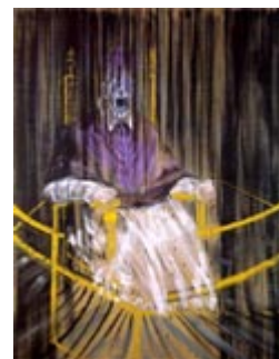
"Inocencio X". F. Bacon

4. Neofiguración: movimiento artístico de la segunda mitad del siglo XX, caracterizado por una vuelta a la pintura figurativa frente a la abstracción, aunque los pintores tratan el tema de una manera informal. El pintor más representativo es el irlandés Francis Bacon, quién retrata la soledad, el horror y la angustia contemporáneas en sus figuras aisladas y deformes. Ejemplo: estudios sobre el retrato del papa Inocencio X , de Velázquez.