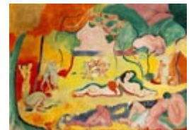
La alegría de vivir (1905-06). HENRI MATISSE

2. Fauvismo: movimiento pictórico de principios del siglo XX caracterizado por un uso expresivo del color, violento y arbitrario (fauve significa fiera, en francés), para expresar sensaciones internas, generalmente placenteras. Tienen influencia de Van Gogh y Gauguin. Representantes: Henri Matisse, el mejor, Vlaminck, Derain.